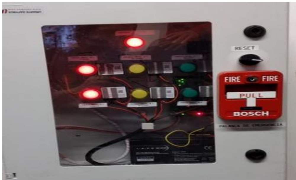
PANEL DE CONTROL RELOJ CONTROL